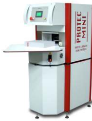
Protec Mini CM