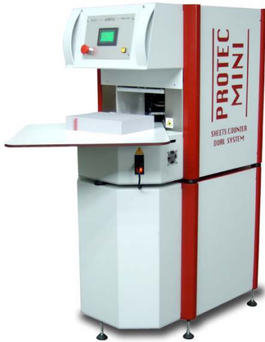
Protec Mini CM mit Untergestell

Dieses System erlaubt auch den Einschuss von Streifen um die gezählten Bögen zu unterteilen und zu markieren. Alle Protec Zählmaschinen verfügen über ein Touch- Screen Display. Somit ist eine bedienerfreundliche und schnelle Anwendung garantiert. Die Maschinen lassen sich je nach Anforderung für Ihren optimalen Einsatz ausrüsten.