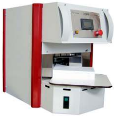
Protec Mini LS

Die Papierzählmaschinen Protec sind für Ihren Einsatz in 3 Ausführungen erhältlich.